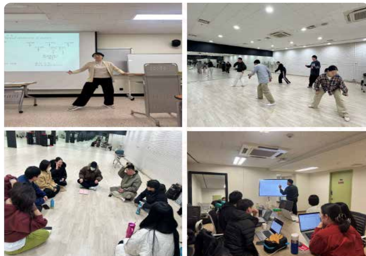
▶ AI웹툰 전문가 과정 수업진행 모습

세종대학교 RISE사업단이 AI허브 입주기업 (주)툰스퀘어와 함께 연계해 국내 최초·유일의 AI웹툰 전문가 교육과정을 개설하며, AI 기반 콘텐츠 창작 역량 강화에 나섰다.