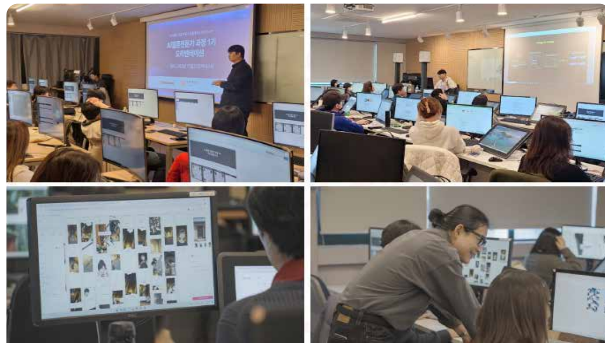
▶ AI웹툰 전문가 과정 수업진행 모습